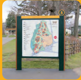
札幌市円山動物園 案内サインのデザイン監修 (札幌市環境局)