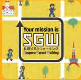
札幌ぐるりウォーキング作成 (札幌市保健福祉局)