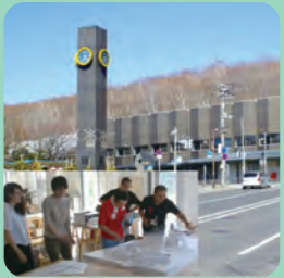
真駒内駅前が 南区の魅力ある玄関に!