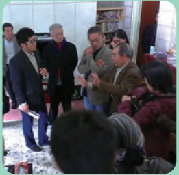
高齢者が元気な町に!