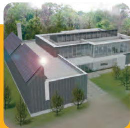
札幌市円山動物園 動物舎のデザイン監修 (札幌市環境局)