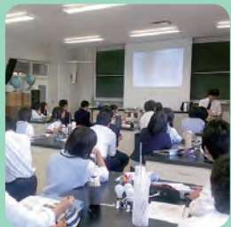
初・中等教育とつながります!