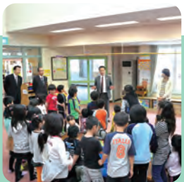
多世代・多セクターによる 交流が活発に!