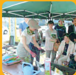
近隣住民との グリーンカーテンプロジェクト協力 (札幌市南区まちづくりセンター)