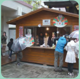
地域の産業や商業と 協力します!