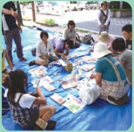
本学学生が 地域に入り込みます!