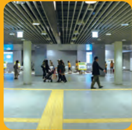
札幌駅前通地下歩行空間 デザイン監修 (札幌市市民まちづくり局)